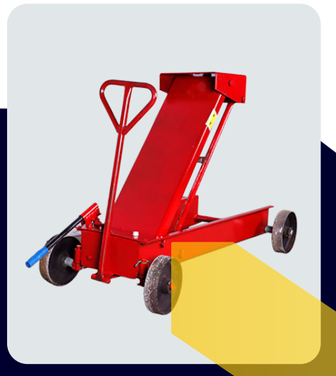
جک گیربکس درآر تک پمپ چدنی ۴ تایر