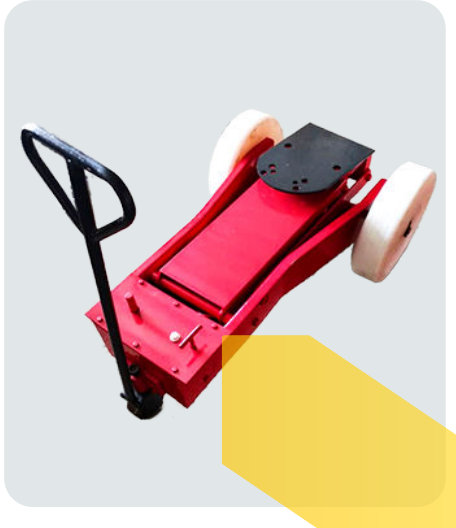
جک گیربکس درآر دو پمپ تایر تفلنی