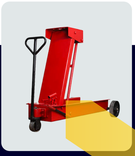
جک گیربکس درآر تک پمپ چدنی ۳ تایر