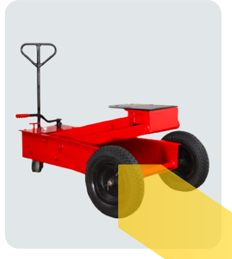
جک گیربکس درآر دو پمپ تایر لاستیکی بادی